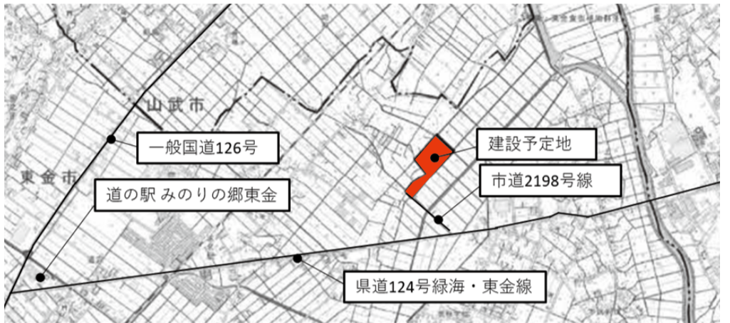
※建設予定地（東金市上武射田地先）位置図